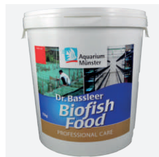
DR. BASSLEER BIOFISH FOOD professional care

Dr. Bassleer Biofish Food professional treat verzorgt de vissen gedurende hun herstelperiode tijdens of na een medicinale behandeling. De magere vissen zullen dan ook weer snel op hun normale gewicht komen. Het bevat verse look, Aloe vera en 4 kruiden (munt, tijm, vogelkruid en alsemkruid).