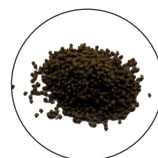
Korrelgrootte XL 1,2 - 1,6 mm voor vissen > 10 cm