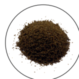
Korrelgrootte M 0,5 - 0,8 mm voor vissen > 1 cm

Dr. Bassleer Biofish Food bevat geen kunstmatige kleurstoffen en heeft een buitengewoon hoog gehalte aan voedingsstoffen. Het is zeer goed verteerbaar en belast het aquariumwater niet.