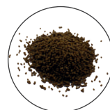
Korrelgrootte L 0,8 - 1,2 mm voor vissen > 5 cm