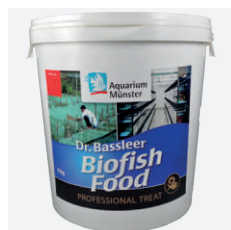
DR. BASSLEER BIOFISH FOOD professional treat